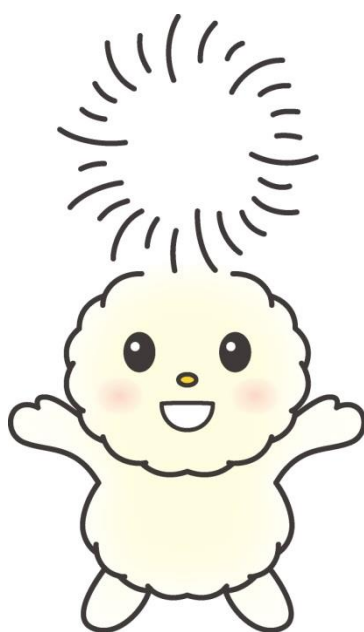
朝霞市キャラクター ぽぼたん